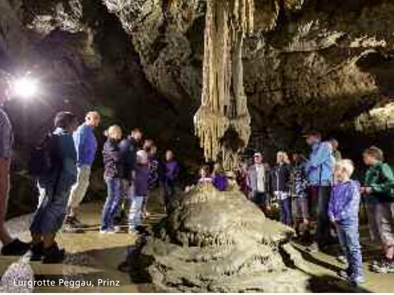
Lurgrotte Peggau, Prinz