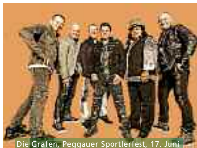
Die Grafen, Peggauer Sportlerfest, 17. Juni