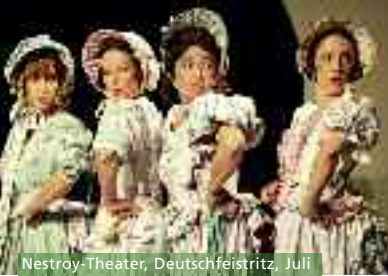
Nestroy-Theater, Deutschfeistritz, Juli