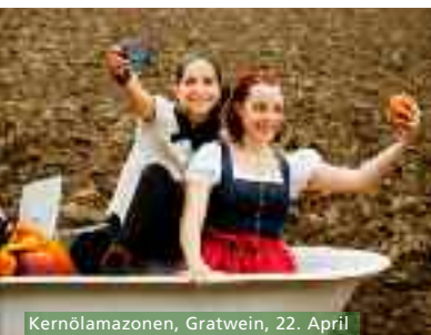
Kernölamazonen, Gratwein, 22. April