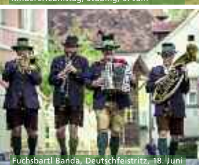
Fuchsbartl Banda, Deutschfeistritz, 18. Juni