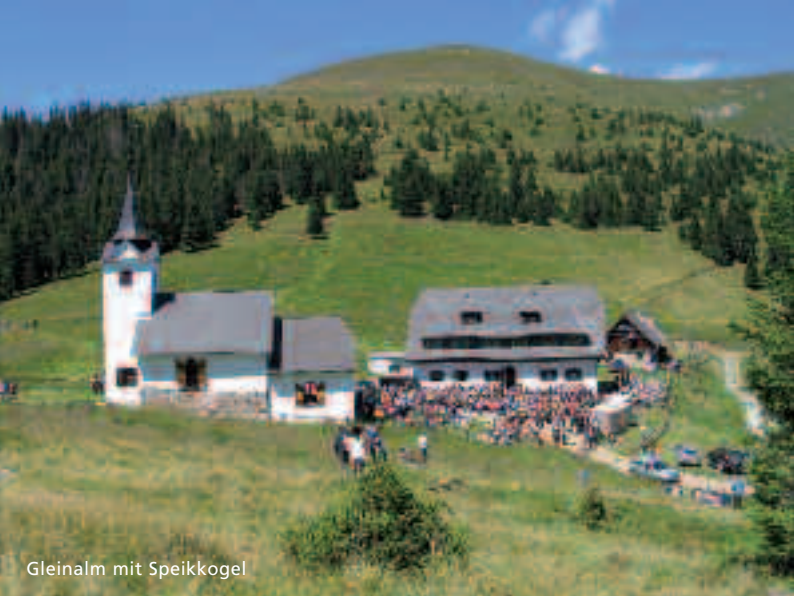
Gleinalm mit Speikkogel