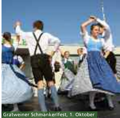
Gratweiner Schmankerlfest, 1. Oktober