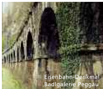
Eisenbahn-Denkmal Badgalerie Peggau