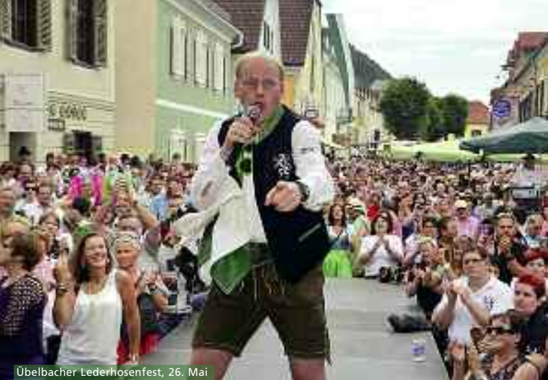
Übelbacher Lederhosenfest, 26. Mai