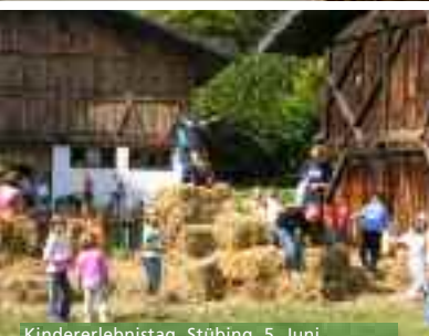
Kindererlebnistag, Stübing, 5. Juni