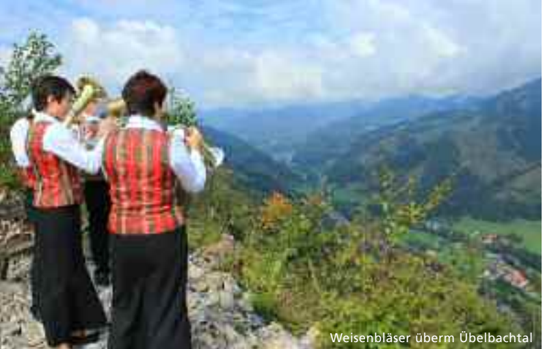
Weisenbläser überm Übelbachtal