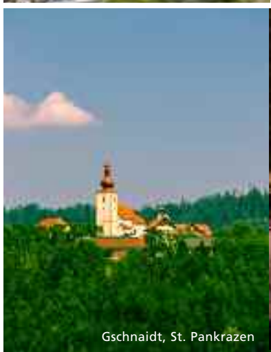
Gschnaidt, St. Pankrazen