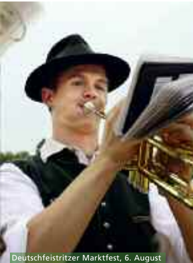
Deutschfeistritzer Marktfest, 6. August