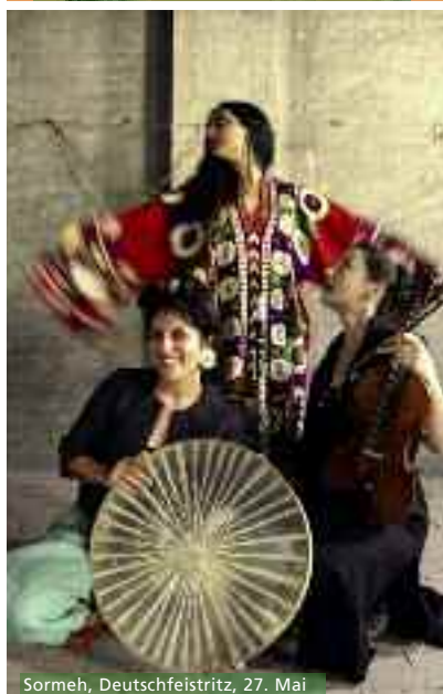
Sormeh, Deutschfeistritz, 27. Mai