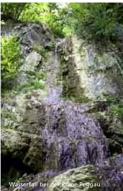
Wasserfall bei der Ruine Peggau