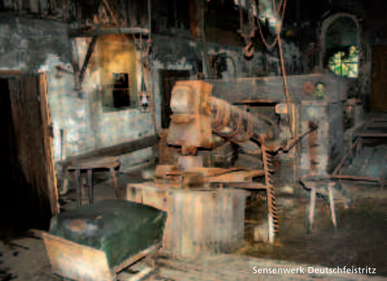
Sensenwerk Deutsche Feistritz