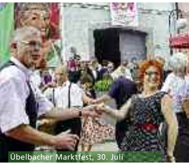
Übelbacher Marktfest, 30. Juli