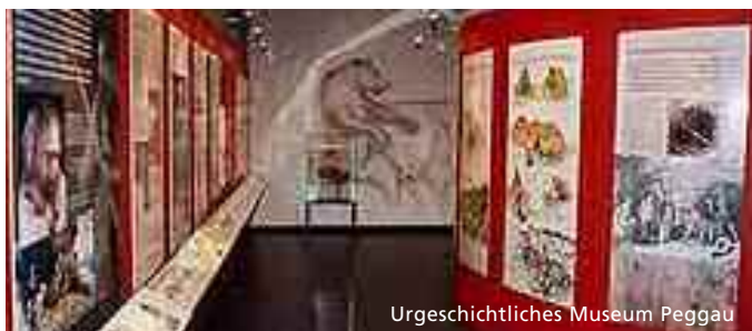
Urgeschichtliches Museum Peggau

8120 Peggau, Grazer Straße 20, T +43 3127 2222 15