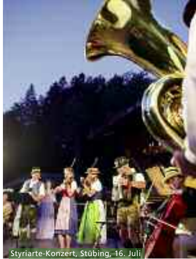
Styriarte-Konzert, Stübing, 16. Juli