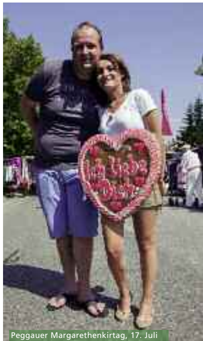
Peggauer Margarethenkirtag, 17. Juli