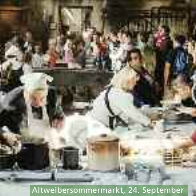
Altweibersommermarkt, 24. September